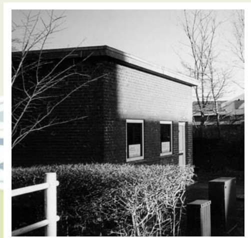
Byens fælles frysehus

Herved opnås en integreret enhed med større kapacitet og fælles udnyttelse af faciliteterne.